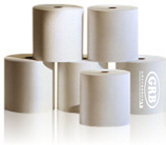
Thermo rullar 57X50